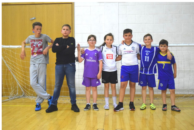
Pobjednička ekipa - BiH Dopunska Škola Derby

Nakon dodjele priznanja, pristupili smo ručku. Isti smo proveli uživajući u ukusnim jelima domaćica, a nakon toga uputili smo se ka sportskoj dvorani gdje su učenici naše dopunske škole također dominirali pa tako osvojili i zlatnu medalju u turniru u malom nogometu.