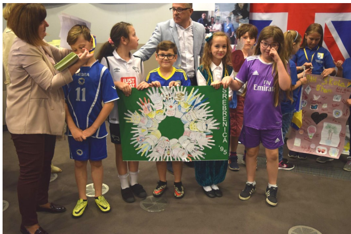
Zajednički rad učenika do 4. razreda BiH Dopunske Škole Derby