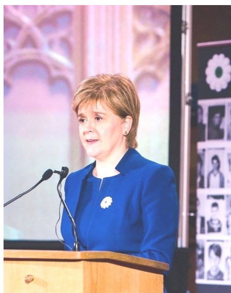
Prva Ministrica Škotske, Nicola Sturgeon

Također, na zadnjoj dženazi je došlo do komplikacija vezanih za betonske mezareve. Osobe koje ukopavaju tijelo u ovakav mezar moraju da budu kvalifikovane, u suprotnom, uprava groblja neće dozvoliti da se ovakav mezar otkrije a pogotovo ne da se zatvori, stoga, potrebno nam je nekoliko dobrovoljaca koji bi izdvojili jedan slobodan dan i prisustvovali ovom treningu kako bi u buduću bili spremni da obavljamo dženaze a da ne ovisimo o drugim osobama koje će za nas to uraditi u vrijeme kada to njima odgovara a ne nama.