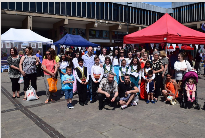
Poslije nastupa za Refugee Week

Naše Udruženje je i ove godine bilo aktivan učesnik u obilježavanju Dana Izbjeglica (Refugee Week). U periodu od 19. do 22. juna, u prostorijama Bosansko-hercegovačkog Centra, upriličena je izložba, a 17. juna naša folklorna sekcija je nastupila ispred Assembly Rooms gdje su, po mom skromnom zapažanju, privukli daleko više pažnje prisutnih i prolaznika od drugih učesnika istog programa.