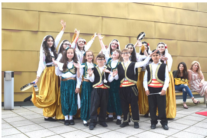
Folklorna Sekcija „Bosanski Biseri“ Derby