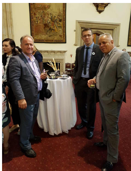
Na prijemu u Guildhall-u