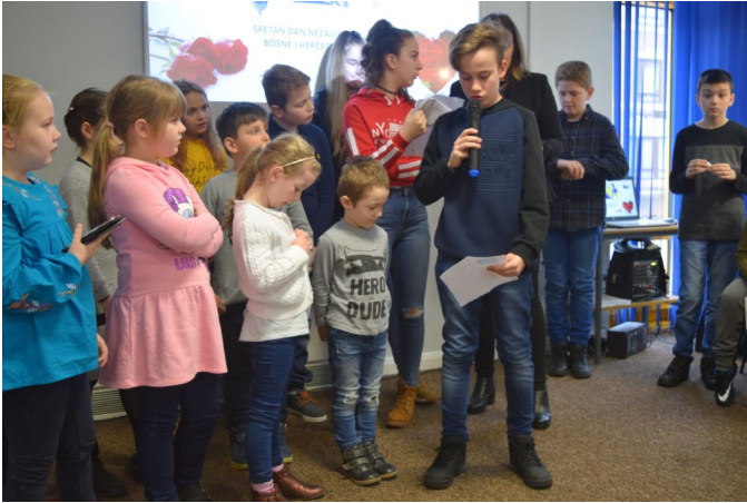
Učenici bh. Dopsne škole iz Coventry-a

Bosansko-Hercegovačko Udruženje Derby, u suradnji sa Bosansko-hercegovačkim Udruženjem Coventry, 3. Marta 2018. godine organizovalo je proslavu povodom obilježavanja Dana nezavisnosti Bosne i Hercegovine.