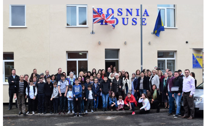
Zajednička fotografija ispred Bosanske Kuće

Krajem Marta, BH UK Network organizovalo je druženje prepuno pozitivne energije kako za učenike tako i za članove BH udruženja Derby i Birmingham. Druženje se održalo u prostorijama Bosanske kuće koje su u podnevnim satima bile ispunjene radošću i žuto plavim bojama naše drage BiH. BH Udruženje Derby se zahvaljuje domaćinu na lijepom dočeku i izuzetno dobroj organizaciji.