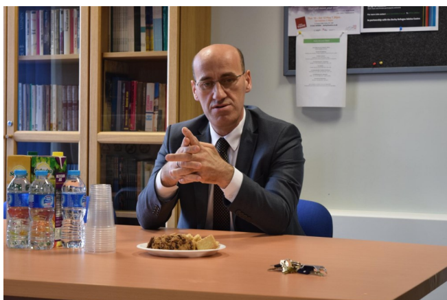
Ramiz Salkić, potpredsjednik bh. entiteta RS

Ramiz Salkić, potpredsjednik bh. entiteta RS, polovinom Aprila je boravio u trodnevnoj posjeti građanima Bosne i Hercegovine koji žive u Velikoj Britaniji, te na skupovima koji su organizovani, govorio o uvezivanju bh. građana u dijaspori, aktivizmu, učešću u demokratskim procesima, investiranju u domovinu, ali i važnosti njegovanja sjećanja na genocid.