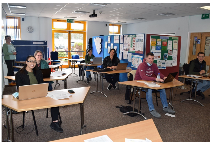
Prevodilački kursu BiH Centru Derby